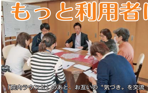
「院内ラウンド」のあと、お互いの「気づき」を交流

「あれ？東神戸病院が利用しやすくなっている」病院に来院されたとき、そう感じることはないでしょうか？それは、互助組合の「病院利用委員会」の活動の成果かもしれません。