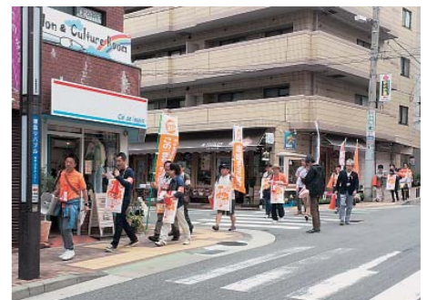
6/11 告示前最後の日曜日、70人以上が4隊に分かれて街を練り歩き宣伝（通称「桃太郎宣伝」）