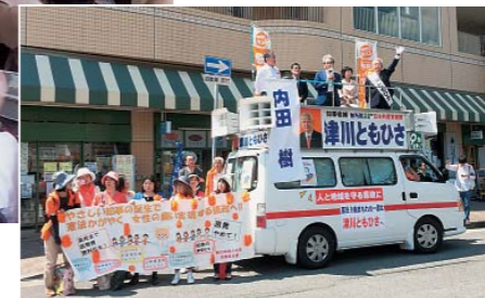
6/15 告示日、JR住吉駅前で第一声

大詰めを迎えた兵庫県知事選挙。私たち神戸医療互助組合も「憲法県政の会」の一員として津川知久さんと県政を転換するために全力をあげています。互助組合員のみならず、大きなご支援ご協力よろしくお願いたします！