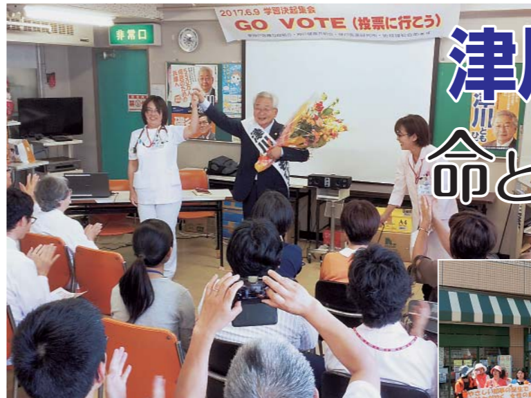
告示日（6月15日）直前、9日に50人を越える参加者で「GO VOTE（投票に行こう）」学習決起集会（病院4階会議室）